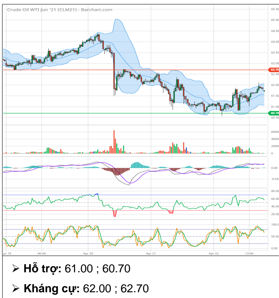
Dầu thô WTI tháng 6 (CLM1)