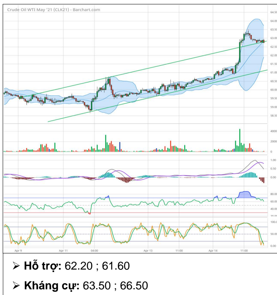
Dầu thô WTI tháng 5 (CLK1)