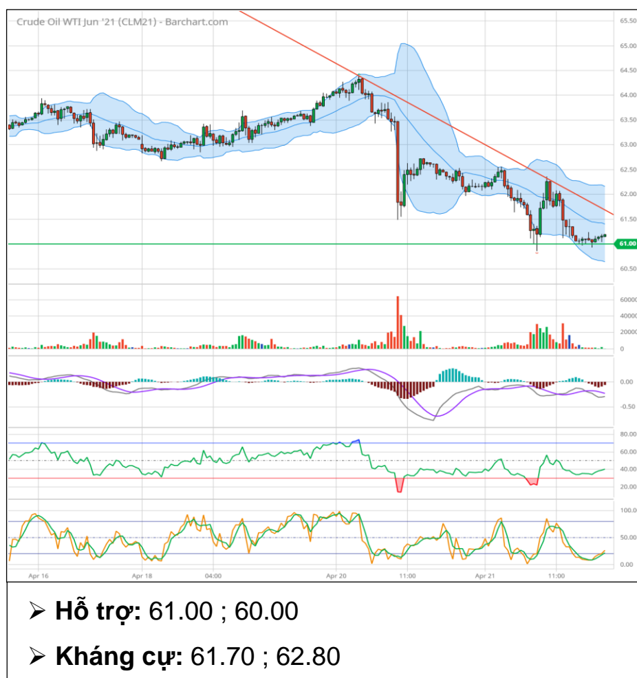
Dầu thô WTI tháng 6 (CLM1)