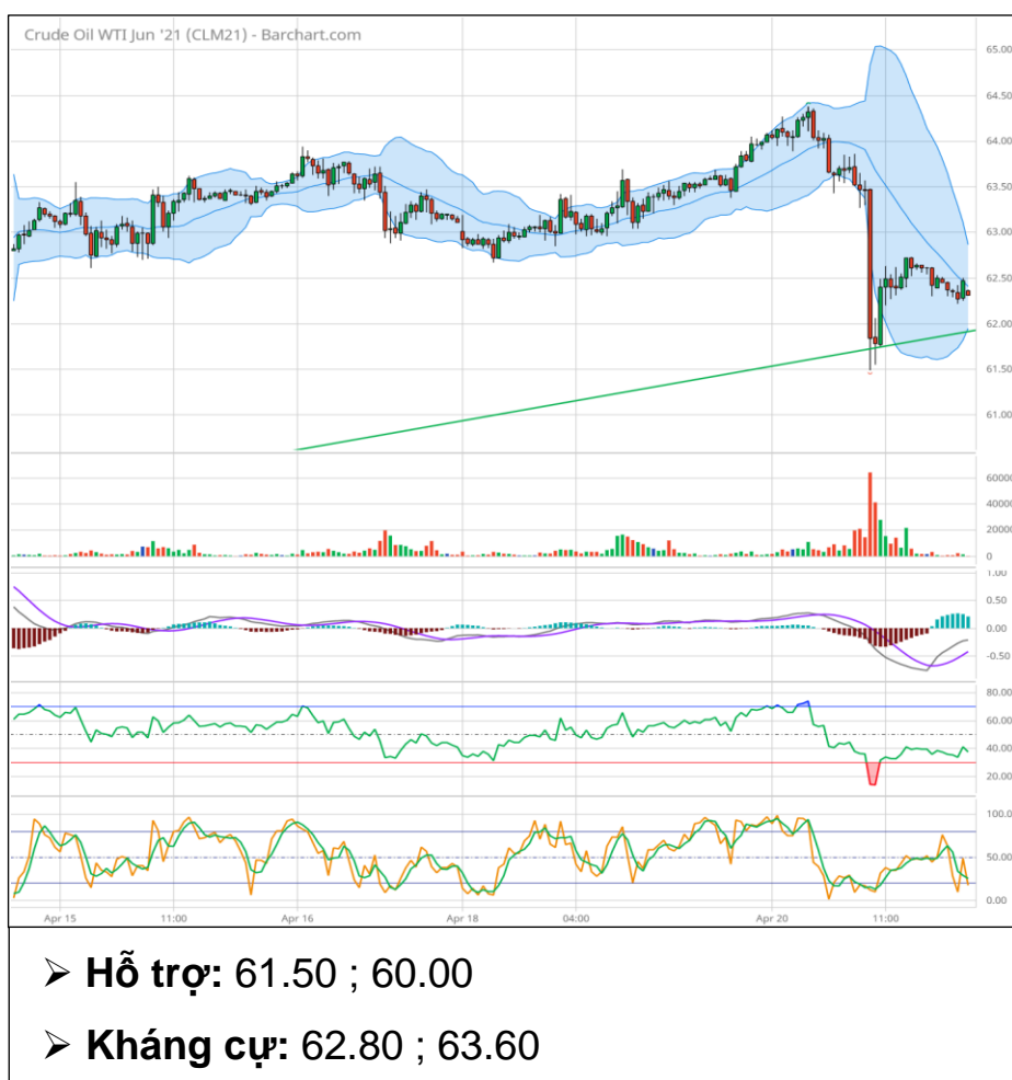
Dầu thô WTI tháng 6 (CLM1)